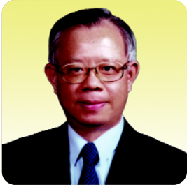
理事會主席 總裁 彭淮南