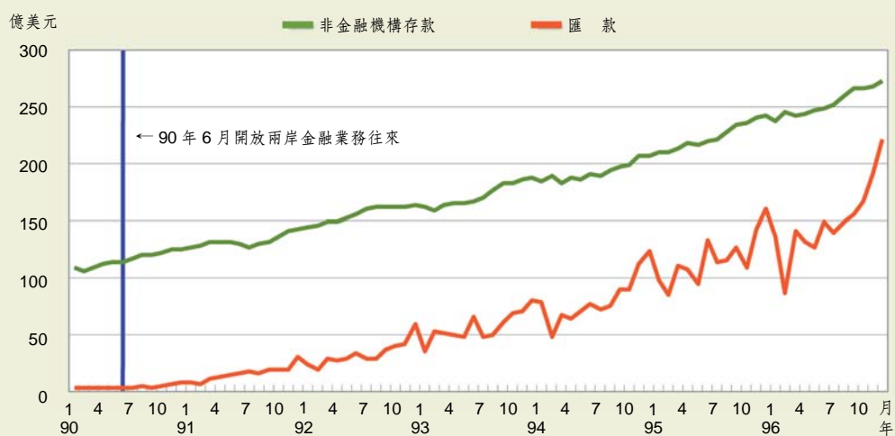
全體 OBU 辦理非金融機構存款及兩岸匯款概況