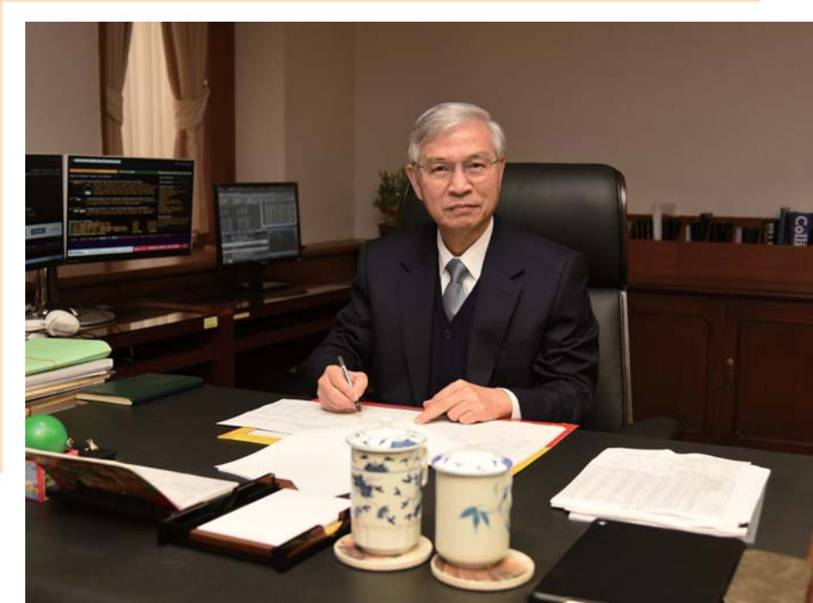
總 裁 楊金龍

民國 106 年，全球景氣穩健復甦，國際原油等商品價格上揚，帶動台灣出口明顯擴張，民間消費維持溫和成長，經濟成長率升為 2.86%，係近 3 年來新高。物價方面，新台幣對美元升值減輕輸入性通膨壓力，加以天候因素，蔬果等食物類價格因比較基期較高呈現下跌，致消費者物價年增率僅 0.62%，不含蔬果及能源之核心消費者物價年增率則為 1.04%，漲幅溫和。