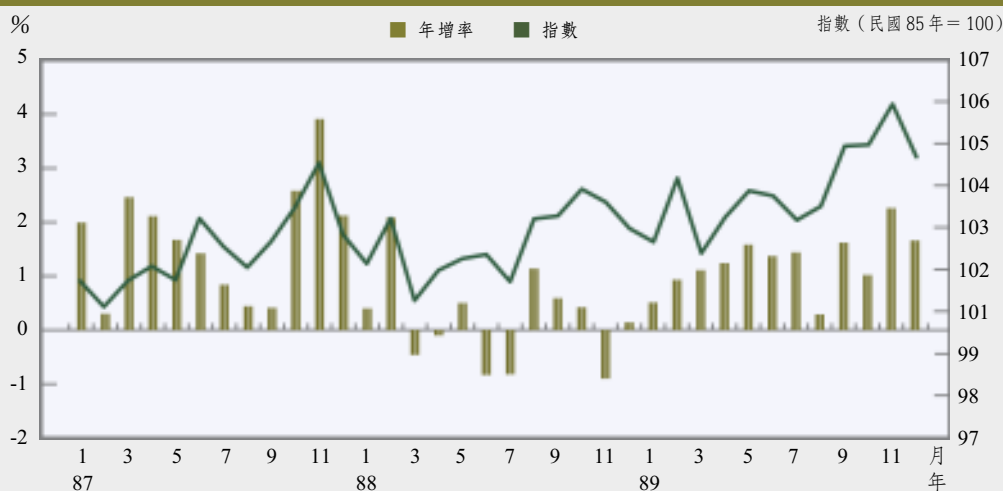
臺灣地區消費者物價指數與年增率

雖蔬菜價格受象神颱風及比較基期偏低影響，年增率為7.10%，以及魚介與家外食物費用持續長期上升趨勢，分別上漲2.70%與1.19%，但由於家禽及家畜等供貨充裕，肉類、蛋類與乳類（跌幅依序為6.57%、10.64%及0.79%）等價格走跌，加以檳榔供給過剩，售價下滑，使休閒消遣食品價格下跌6.47%等影響，食物類價格指數年增率僅0.15%，相當平穩。