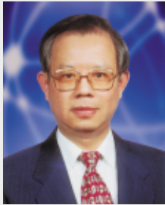
理事會主席 總裁 彭淮南