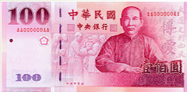
100 元券 紅色系 145mm×70mm