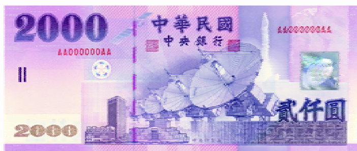
2000 元券 紫色系 165mm×70mm