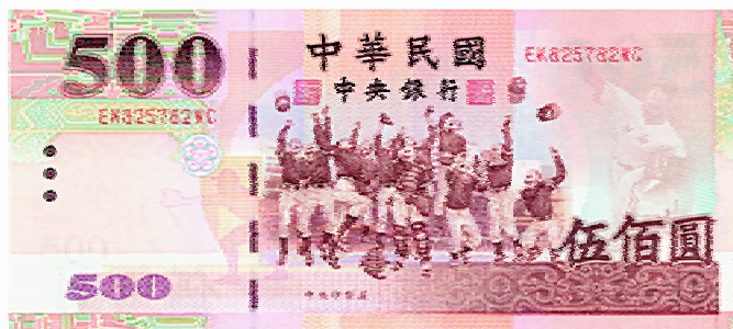
500 元券 咖啡色系 155mm×70mm