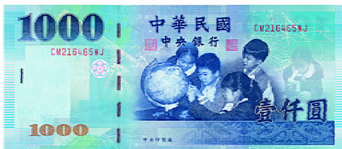
1000 元券 藍色系 160mm×70mm