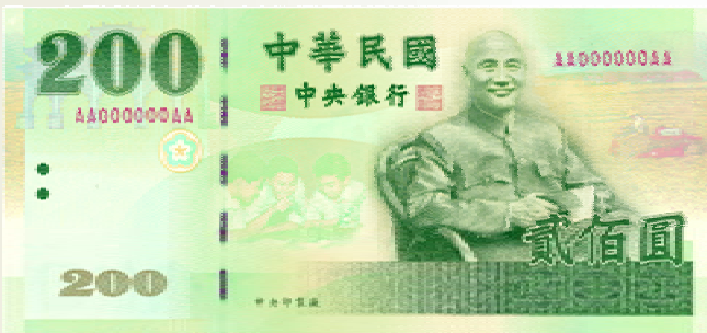
200 元券 綠色系 150mm×70mm