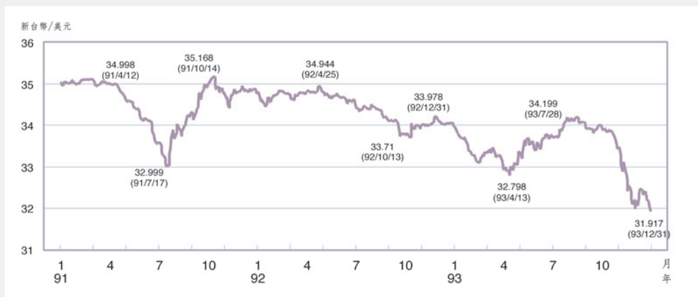
新台幣匯率（每日銀行間美元交易收盤價）

就新台幣對美元之銀行間即期外匯市場成交量來看，以11月的261.7億美元為最多，其次為3月的258.2億美元。11月因匯率多空看法分歧，市場交投熱絡，致波動範圍最大，而3月22日則受總統大選引發爭議影響，外資大幅匯出，廠商搶購美元，以致當日銀行間成交量達29.9億美元，為全年單日最大成交量。