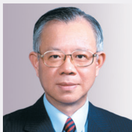
理事會主席 總裁 彭淮南