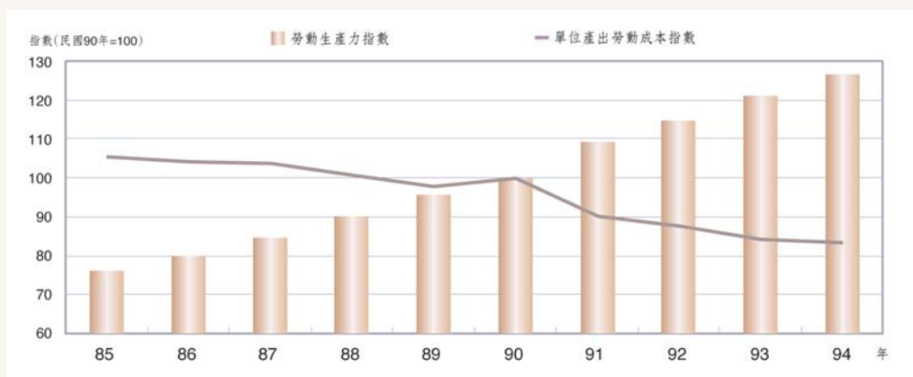
工業部門勞動生產力指數與單位產出勞動成本指數

受雇員工薪資與生產力方面，本年非農業部門(工業與服務業部門)每人每月平均薪資為43,615元，較上年增加1.38%，惟實質平均薪資較上年減少0.90%，係繼91年負0.69%後，第二次負成長。工業部門與其中的製造業每人每月平均薪資分別為