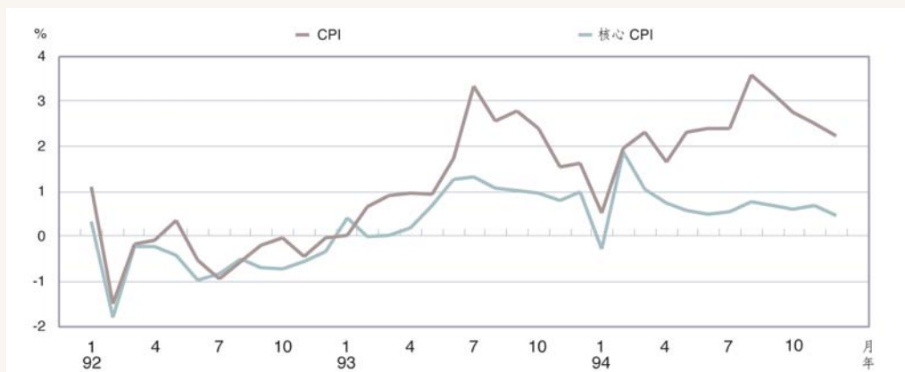
消費者物價指數年增率

本年上半年，CPI年增率表現尚稱溫和，惟下半年在連續三個颱風來襲影響下，蔬菜、水果價格高漲，使得CPI年增率曾經連續二個月達3%以上；至於全年各