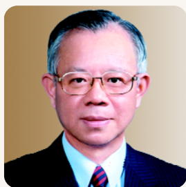
理事會主席 總裁 彭淮南