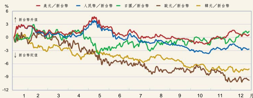
95 年新台幣對主要通貨之升貶幅度（與 94/12/30 比較）

會議公報要求中國人民幣及亞洲國家貨幣採取更有彈性之匯率制度、市場預期 Fed 升息將近尾聲、以及日本經濟數據強勁，國際美元持續走貶；國內因外資持續匯入暨銀行賣出美元部位，新台幣對美元匯率走升，5 月 10 日升至本年最高價位 31.338 元。嗣後國際美元雖受美國經濟成長減緩及 Fed 8 月暫停升息等不利因素影響，惟北韓試射飛彈及中東情勢緊張等地緣政治不穩定，市場持有美元意願增強；國內因外資及壽險業者匯出資金，以及銀行及進口商買入美元部位，致新台幣對美元走貶，10 月 25 日貶至 33.316 元之全年最低價位。11 月開始因美國經濟數據表現疲弱以及歐元區調升利率，歐美利差縮小，國際美元走貶，國內因受亞洲貨幣對美元走升以及外資持續匯入，新台幣對美元匯率由貶轉升，12 月底新台幣對美元匯率為 32.596 元。本年底與上年底比較，新台幣對美元微幅升值 0.78%。就全年平均值而言，本