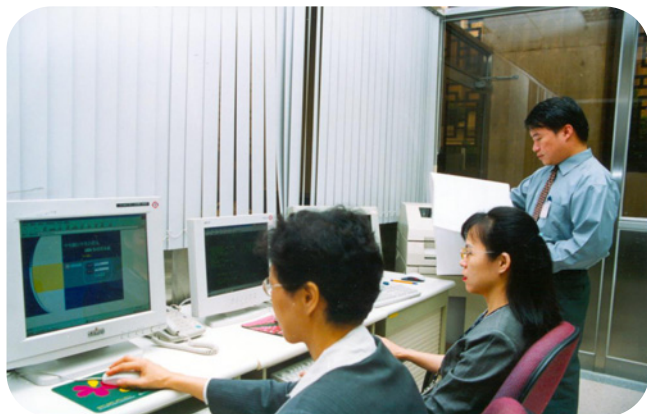
中央公債及國庫券電子連線投標系統

訂價，對債券市場的健全發展助益很大。投標單位也可透過系統傳送相關報表，或連線查詢列印相關資訊，有效提升作業品質及效率。