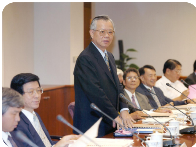
理事會是中央銀行最高決策單位

貨幣政策的走向。除了定期集會以外，如遇有與貨幣政策有關的重大議題或其它重要事項，為爭取時機，則以召開臨時會或電話徵詢理監事意見等方式，做成決策，並發布新聞。