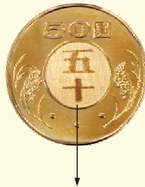
「五十」及「50」字樣之隱藏圖案

分別為壹仟元券、伍佰元券、壹佰元券、貳佰元券及貳仟元券，每半年發行一種面額。本年1月發行貳佰元券，7月發行貳仟元券後，新版鈔券系列已全部完成發行。另於4月26日發行新版伍拾元幣。