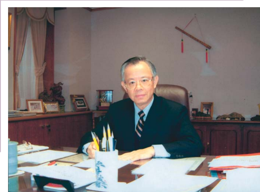
總 裁 彭淮南

105年上半年，全球景氣不振，我國出口衰退，經濟疲弱；至下半年，因半導體需求回升，出口恢復成長，帶動民間投資升溫，民間消費亦維持溫和成長，景氣回溫，全年經濟成長率為1.50%，高於上年之0.72%。物價方面，受天候影響，蔬果等食物類價格高漲，推升消費者物價，全年年增率為1.40%，不含蔬果及能源之核心消費者物價年增率則為0.84%，漲幅溫和。