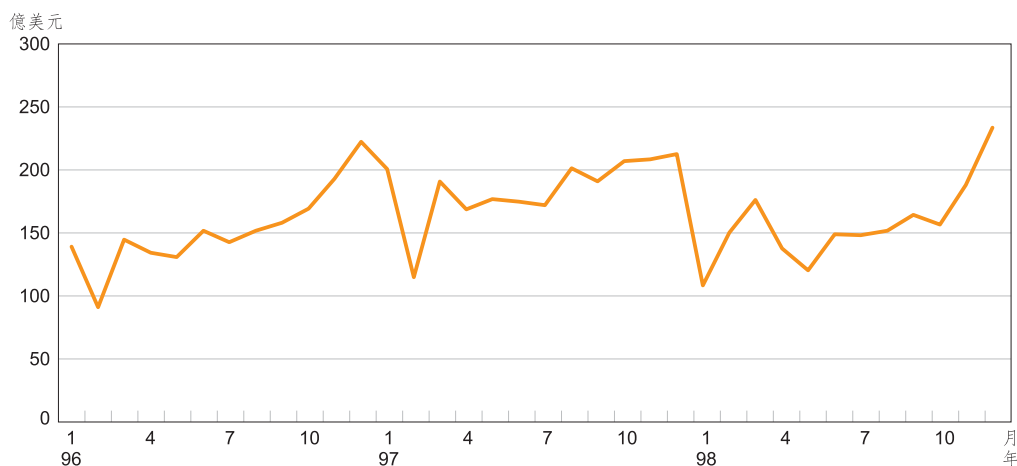
全體 OBU 辦理兩岸匯款業務量

自民國 90 年 6 月開放 OBU 辦理兩岸直接通匯以來，匯款業務持續穩定發展，