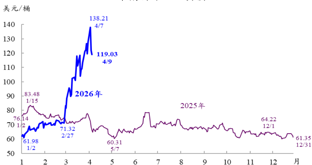
布蘭特原油現貨價格

本(2026)年 2 月底中東戰爭爆發，擾亂原油供應，布蘭特原油現貨價格大幅上漲，至 4 月 7 日為每桶 138.21 美元。嗣因巴基斯坦居中斡旋，美伊達成停火兩週協議，油價自高點大幅回落，至 4 月 9 日為每桶 119.03 美元，仍較 2 月 27 日中東戰事爆發前上漲 66.9%。