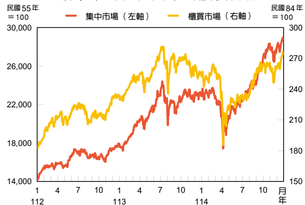
集中市場及櫃買市場股價指數

下跌類股中，建材營造類股由於房市景氣放緩，建商推案量大減，股價下跌 24.3% 最多；文化創意類股因上年漲多，股價拉回下跌 22.9%；鋼鐵類股因中國大陸需求疲弱及產能過剩，拖累股價下跌 15.9%。114 年櫃買市場股票日平均成交值為 1,056 億元，較上年增加 9.9%。