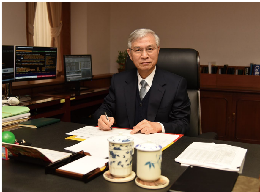
總 裁 楊金龍

民國 112 年，雖疫後國人外出消費需求強勁，民間消費大幅成長；惟全球終端產品需求疲弱，台灣輸出與民間投資轉呈衰退，全年經濟成長率由上（111）年之 2.59% 降為 1.31%。物價方面，疫後國人外出餐飲、娛樂服務消費供不應求，服務類價格大幅上漲，惟進口原油等原物料行情回跌，國內商品類價格漲幅減緩，消費者物價年增率由上年之 2.95% 回降為 2.49%；不含蔬果及能源之核心消費者物價年增率則由上年之 2.61% 略降為 2.58%。