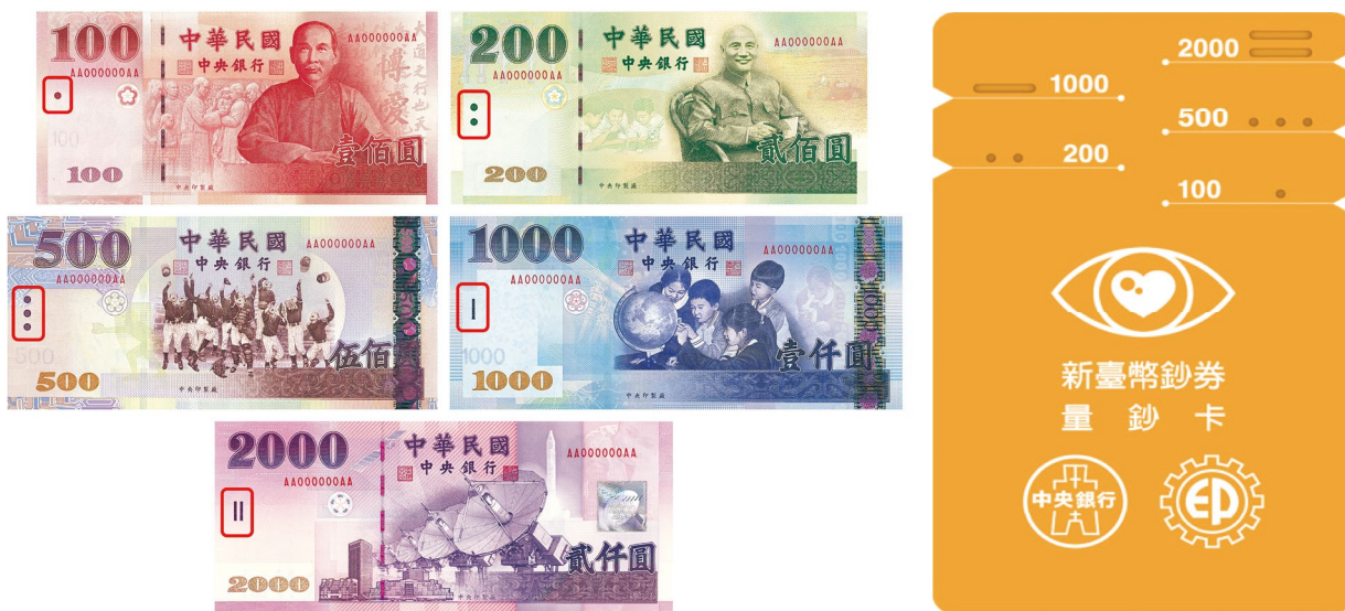
新臺幣鈔券之盲人點圖案與新臺幣鈔券量鈔卡

111 年推出「豐饒的大地」主題特展，內容包括「經濟作物」、「特色植物」及「地下礦藏」等三個單元，共展出國外鈔券 55 件，其中部分鈔券已不再流通，極為罕見，彌足珍貴，民眾可隨時上網觀賞世界各國鈔券之設計風格與特色。