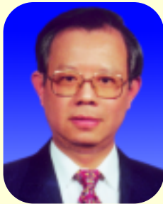
理事會主席 總裁 彭淮南