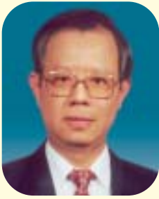
理事會主席 總裁 彭淮南