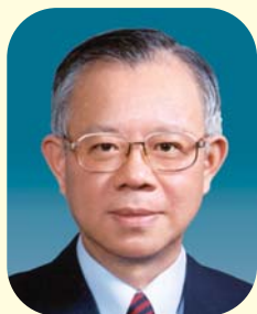
理事會主席 總裁 彭淮南